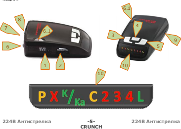
224В Антистрелка -5- CRUNCH 224В Антистрелка

На рисунке показан внешний вид прибора, органы управления и индикации: